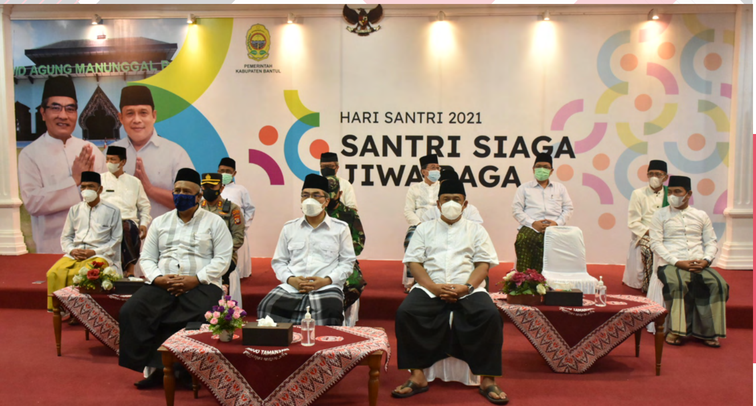
Dinas Kominfo Kab. Bantul