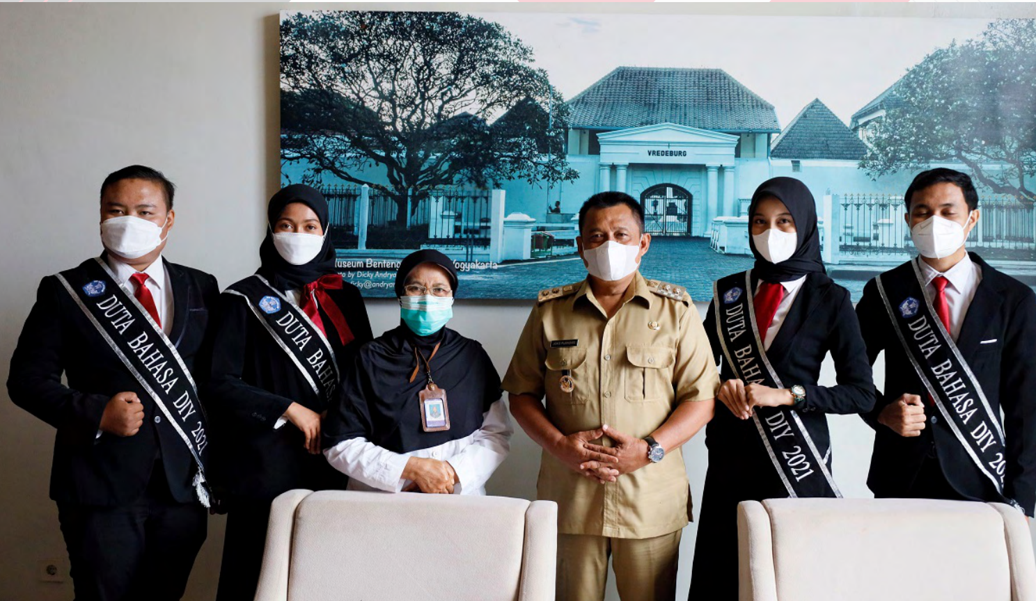
Dinas Kominfo Kab. Bantul