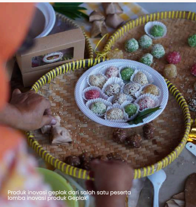
Produk inovasi geplak dari salah satu peserta lomba inovasi produk Geplak