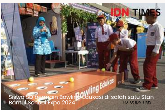
Siswa SD Bermain Bowling Edukasi di salah satu Stan Bantul School Expo 2024

Dalam kesempatan tersebut, juga sekaligus membuka secara resmi kegiatan Bantul School Expo tahun 2024 yang akan berlangsung sejak tanggal 02 Mei 2024 hingga 07 Mei 2024. Bantul School Expo menampilkan hasil karya dan bakat anak-anak didik se-Kabupaten Bantul.