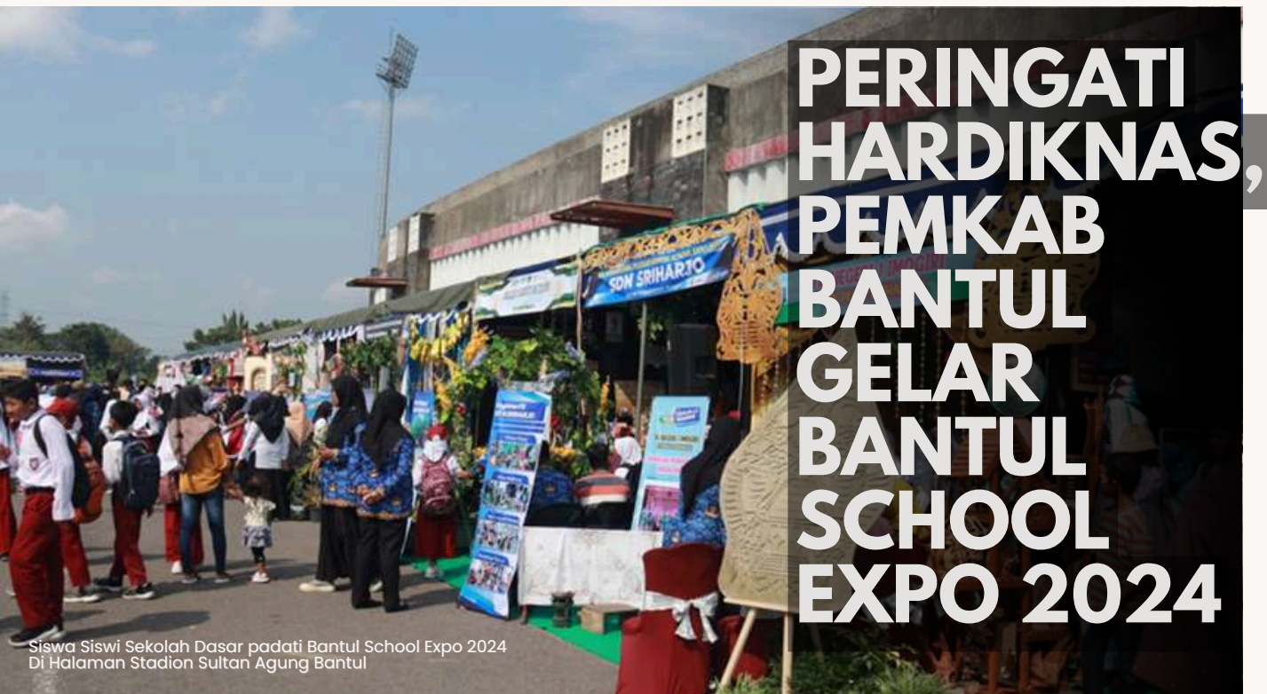
Siswa Siswi Sekolah Dasar padati Bantul School Expo 2024 Di Halaman Stadion Sultan Agung Bantul