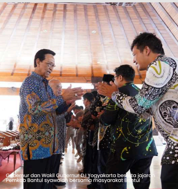
Gubernur dan Wakil Gubernur D.I Yogyakarta beserta jajaran Pemkab Bantul syawalan bersama masyarakat Bantul