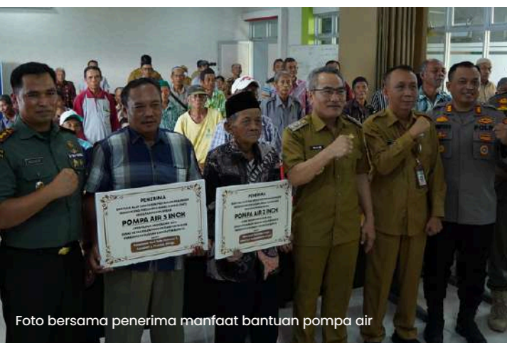
Foto bersama penerima manfaat bantuan pompa air

Usai serah terima alsintan, bupati beserta jajaran mengunjungi wedi kengser (tanah yang terletak di sepanjang aliran sungai) di Dusun Ngentak, Poncosari, Srandakan untuk meninjau kawasan potensial pertanian. Pihaknya ingin mendorong para petani untuk memanfaatkan wedi kengser sebagai lahan pertanian, serta akan memberikan bantuan berupa pupuk untuk para petani.