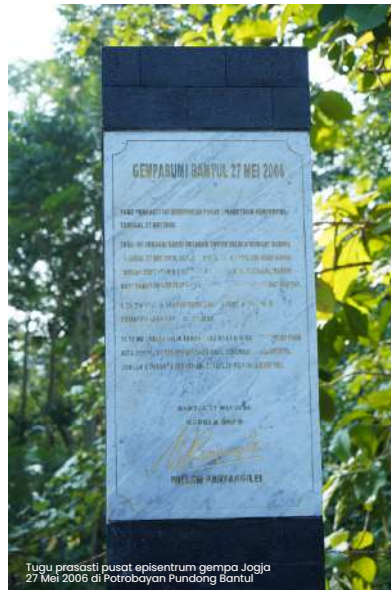
Tugu prasasti pusat episentrum gempa Jogja 27 Mei 2006 di Potrobayan Pundong Bantul