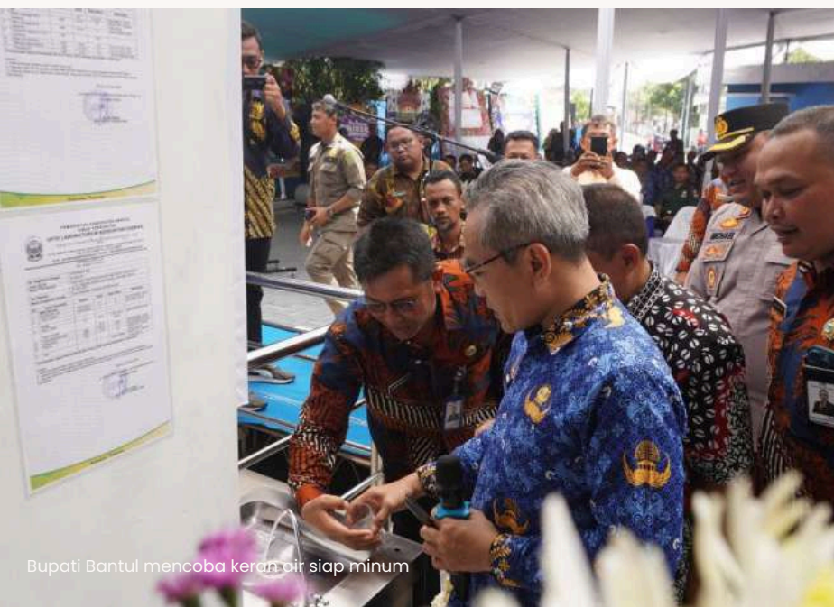
Bupati Bantul mencoba keran air siap minum

Bantul adalah daerah yang sedang tumbuh. Terdapat banyak UMKM, terutama dibidang kuliner yang membutuhkan air bersih. Sehingga jika harga air bersih naik, maka dikhawatirkan akan terjadi inflasi lokal.