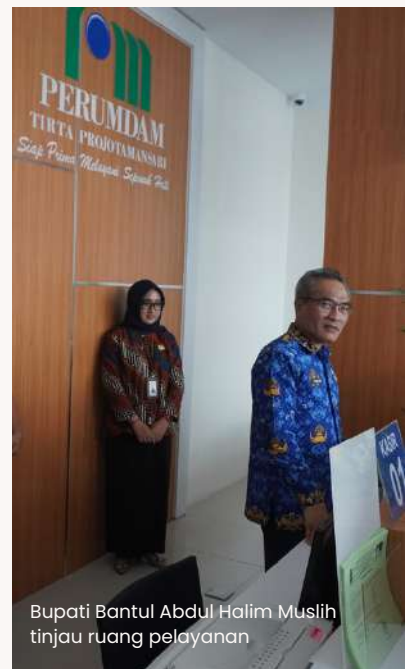
Bupati Bantul Abdul Halim Muslih tinjau ruang pelayanan

Bupati Bantul yang secara resmi meresmikan gedung baru ini menerangkan bahwa berdasarkan Peraturan Pemerintah Nomor 54 Tahun 2017, Badan Usaha Milik Daerah (BUMD) memiliki 3 fungsi, yaitu mendukung pertumbuhan ekonomi, sebagai lembaga yang harus mendapatkan profit atau profit oriented, dan sebagai pelayanan publik.