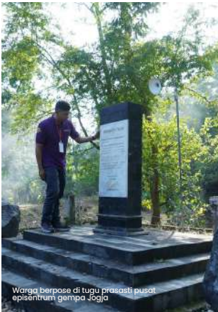
Warga berpose di tugu prasasti pusat episentrum gempa Jogja

berada di Kabupaten Bantul. Gempa yang bersumber dari Sesar Opak yang berlokasi di wilayah Potrobayan, Srihardono, Pundong, Bantul pada 27 Mei 2006 silam, menewaskan lebih dari 4000 korban jiwa di Kabupaten Bantul.