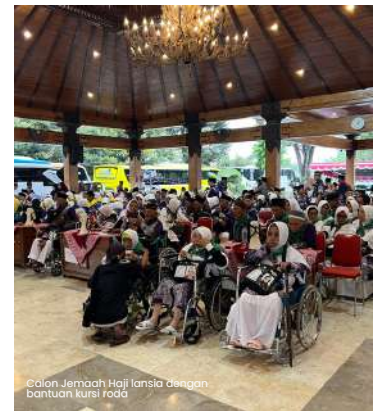
Calon Jemaah Haji lansia dengan bantuan kursi roda