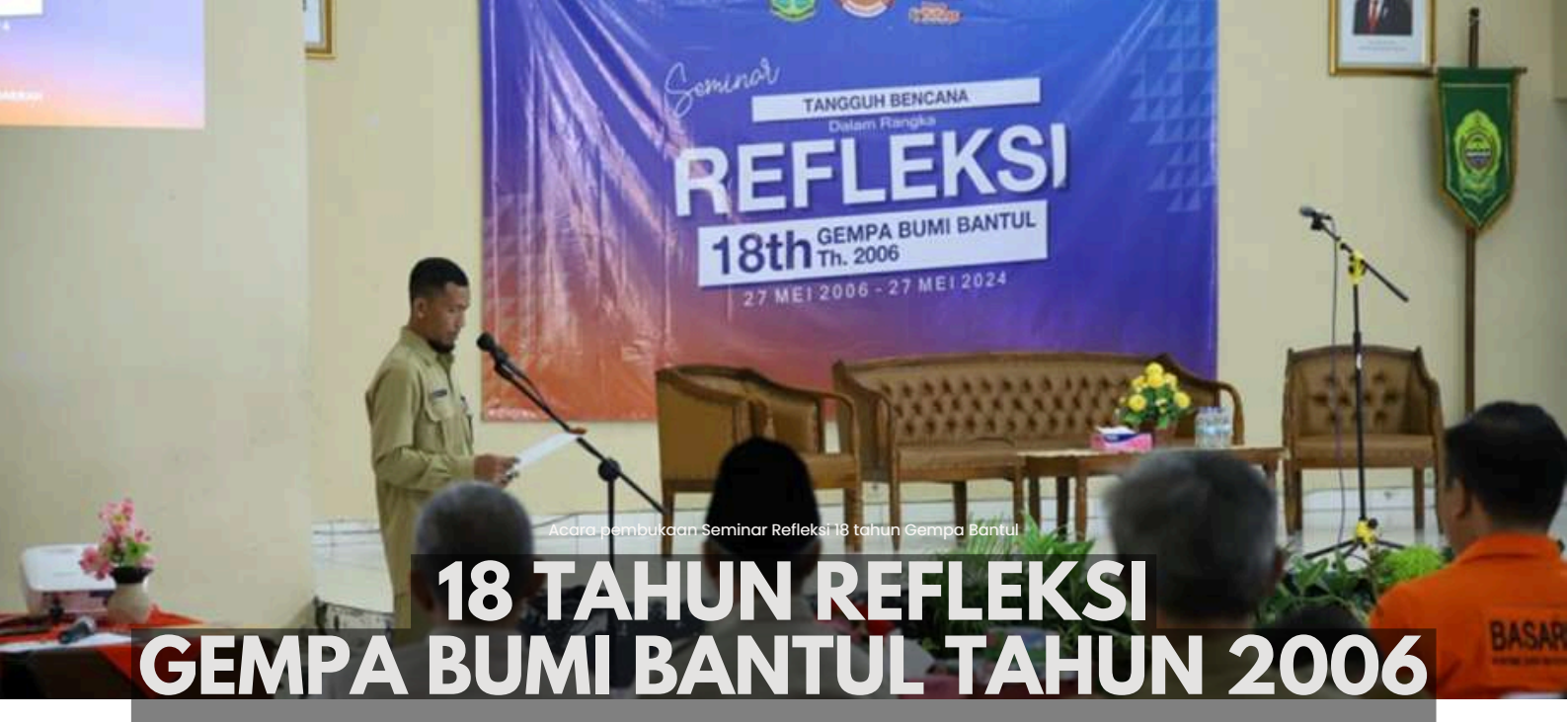
Acara pembukaan Seminar Refleksi 18 tahun Gempa Bantul