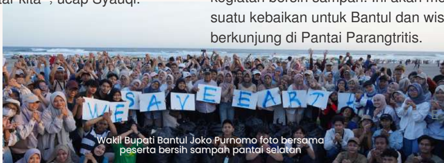
Wakil Bupati Bantul Joko Purnomo foto bersama peserta bersih sampah pantai selatan

“Kami dari Pemerintah Kabupaten Bantul mengucapkan terima kasih, mengapresiasi dan memberikan penghargaan kepada seluruh elemen pemuda-pemudi yang mengadakan kegiatan bersih sampah. Ini akan membawa suatu kebaikan untuk Bantul dan wisatawan yang berkunjung di Pantai Parangtritis.