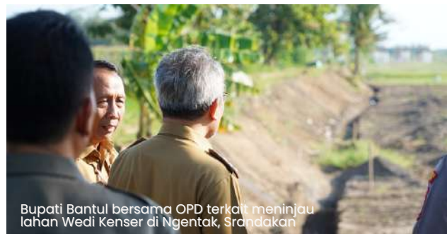
Bupati Bantul bersama OPD terkait meninjau lahan Wedi Kenser di Ngentak, Srandakan

Menurut Bupati, pemkab sebagai pemangku kepentingan dan kebijakan dapat membantu dari sisi hulu, yaitu berupa penyediaan alat-alat pertanian yang modern agar produktivitas hasil pertanian dapat lebih maksimal dan efisien serta dapat menekan kerugian jika terjadi gagal panen.