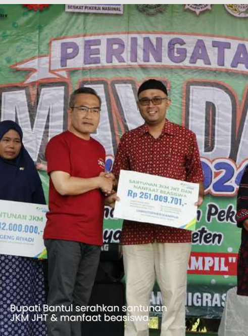
Bupati Bantul serahkan santunan JKM JHT & manfaat beasiswa

Sambutan Bupati didepan para pekerja di halaman BLK Bantul