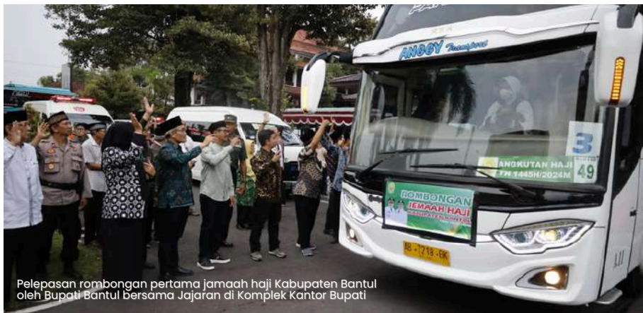
Pelepasan rombongan pertama jemaah haji Kabupaten Bantul oleh Bupati Bantul bersama Jajaran di Komplek Kantor Bupati

P emberangkatan calon jemaah haji dari Kabupaten Bantul untuk kelompok terbang (kloter) yang pertama yakni 49 SOC