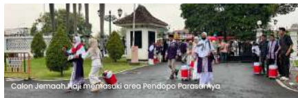
Calon Jemaah Haji menaiki area Pendopo Parasamya