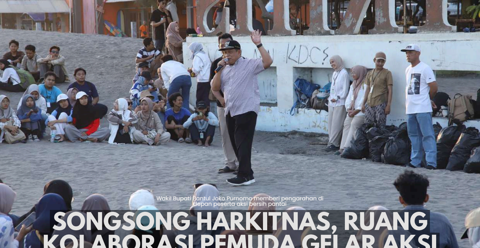
Wakil Bupati Bantul Joko Purnomo memberi pengarahan di depan peserta aksi bersih pantai