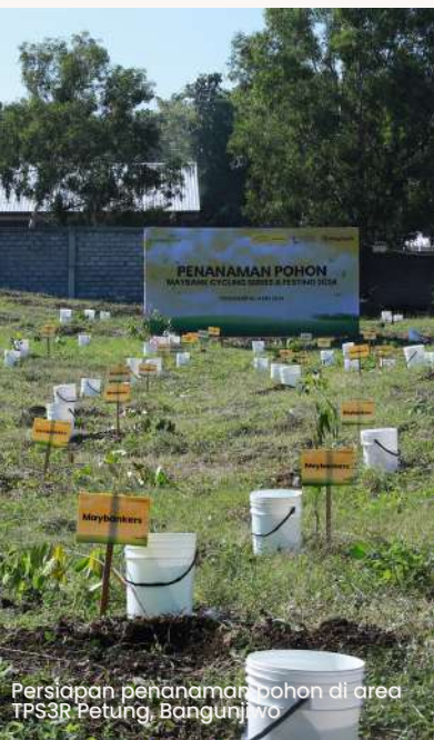
Persiapan penanaman pohon di area TPS3R Petung, Bangunjiwo

Pekerja dan mesin pemilah sampah di TPS3R Petung, Bangunjiwo