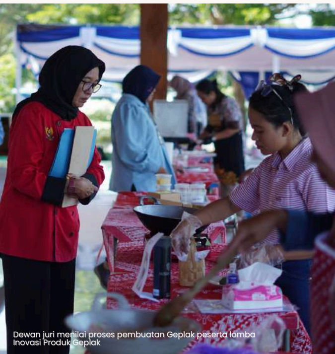
Dewan juri menilai proses pembuatan Geplak peserta lomba Inovasi Produk Geplak