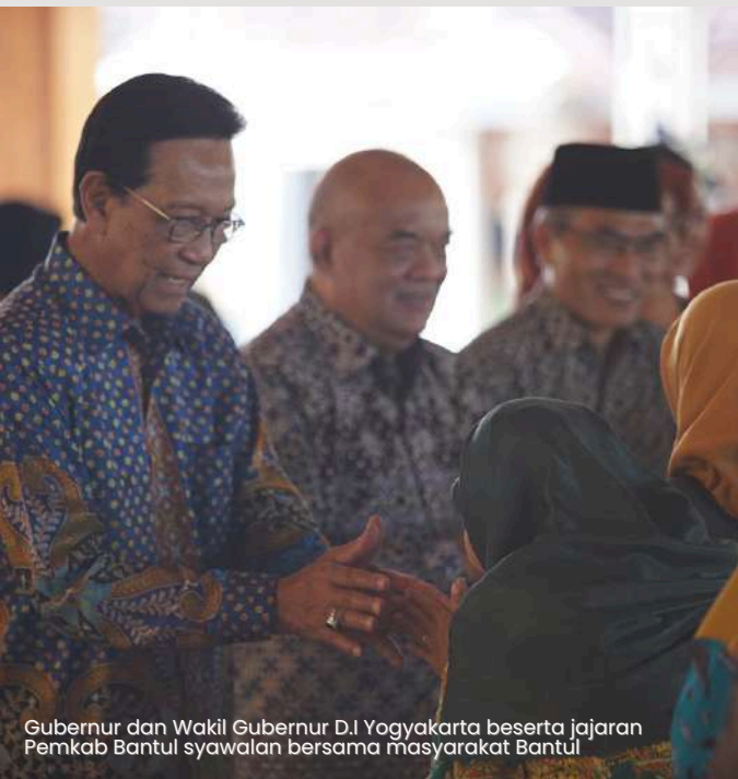
Gubernur dan Wakil Gubernur D.I Yogyakarta beserta jajaran Pemkab Bantul syawalan bersama masyarakat Bantul