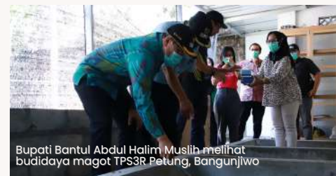
Bupati Bantul Abdul Halim Muslih melihat budidaya magot TPS3R Petung, Bangunjiwo

"Kolaborasi ini sangat bermanfaat dan pemerintah kabupaten sangat apresiasi kepada semua pihak yang terlibat di dalam proyek yang sangat bagus ini," kata Bupati.