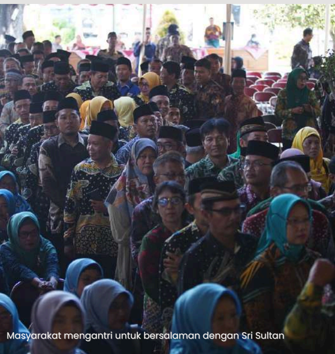
Masyarakat mengantri untuk bersalaman dengan Sri Sultan