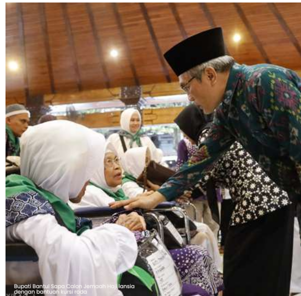
Bupati Bantul Sapa Calon Jemaah Haji lansia dengan bantuan kursi roda

Bupati Bantul mengingatkan kepada seluruh jemaah calon haji untuk selalu menjunjung tinggi etika dan nilai-nilai islam yang mulia selama menjalankan ibadah dan selama tinggal di tanah suci. Selain itu, ia berpesan agar calon jemaah haji bisa menjadi duta yang baik bagi negara kita dan Kabupaten Bantul, dengan mengedepankan sikap saling menghormati, tolong-menolong, dan kepedulian terhadap sesama.